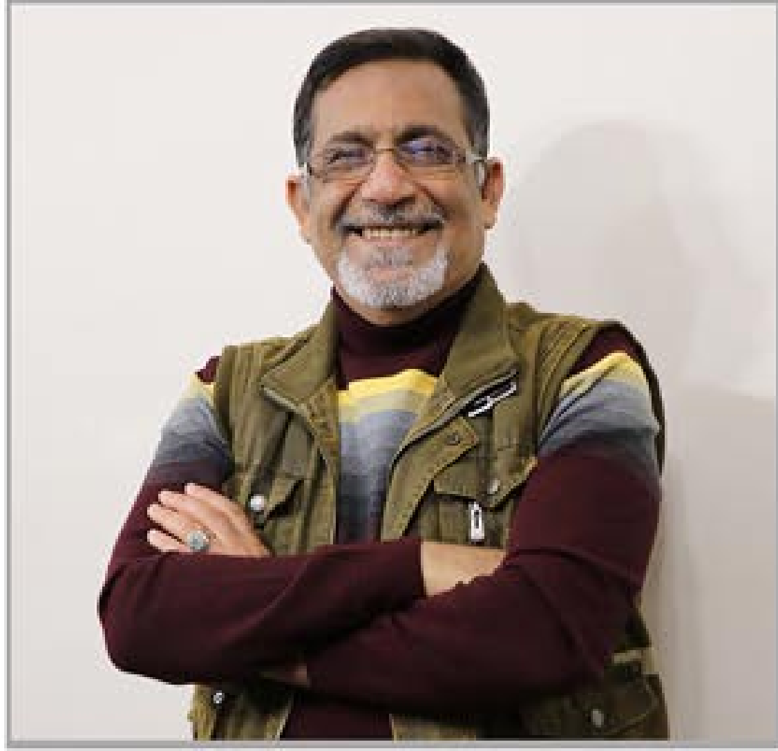
مہر تظہی سخاوت